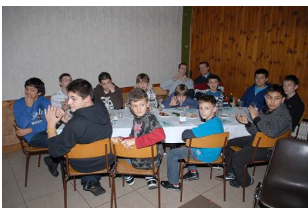
Die jungen Basketballer